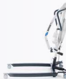
Birdie EVO Versão premium

O tamanho reduzido do Birdie EVO Compact permite executar manobras de forma fácil em espaços reduzidos. Dobrável e com abertura de pernas manual. Disponível com barra de cesta de 2 pontos ou 4 pontos. Fornecido com cesta standard.