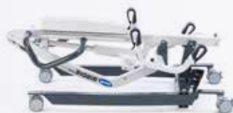
Birdie EVO COMPACT

Versão melhorada do líder de mercado Birdie, desenvolvida para possibilitar transferências seguras, tanto em ambientes institucionais como domiciliários. Dobrável e com abertura de pernas manual. Disponível com barra de 4 pontos. Fornecido com cesta standard.