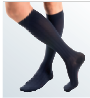
meia até ao joelho