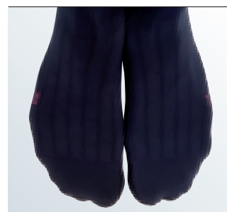
pé anatomicamente concebido, com lado esquerdo e direito

mediven for men – bem-estar ao mais alto nível – para qualquer homem. Veja por si mesmo, ficará convencido.