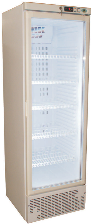
ARV 400 CS PV NL Pharma Cod. 800664